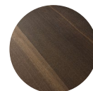
Cepillado Tipo 2